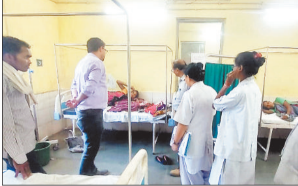
सीएचसी में भर्ती मरीजों के स्वास्थ्य की जानकारी लेते सीएमएचओ।