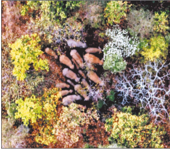
ड्रोन कैमरे से ली गई गजदल की तस्वीरें।