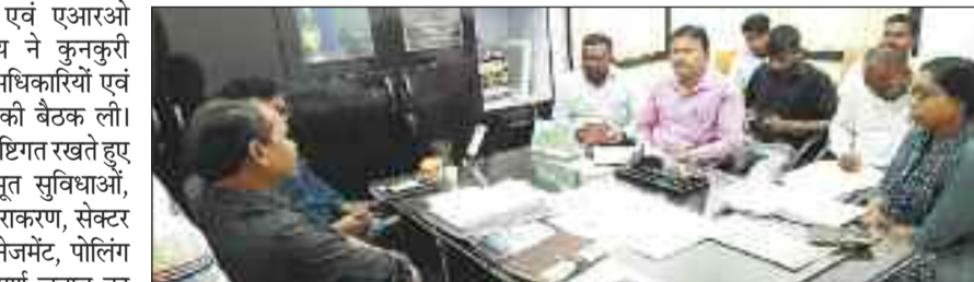
राजस्व अधिकारियों की बैठक लेते एसडीएम।

जशपुरनगर। कुनकुरी एसडीएम एवं एआरओ रायगढ़ संसदीय क्षेत्र नन्द पाण्डेय ने कुनकुरी विधानसभा क्षेत्र के समस्त राजस्व अधिकारियों एवं विभिन्न ब्लाक नोडल अधिकारियों की बैठक ली। उन्होंने आगामी लोकसभा चुनाव को दृष्टिगत रखते हुए मतदान केन्द्रों का भ्रमण कर मूलभूत सुविधाओं, पिछले चुनाव में आये दिक्कतों का निराकरण, सेक्टर अधिकारियों से समन्वय, इव्हीएम मैनेजमेंट, पोलिंग दल के प्रशिक्षण, सुचारु एवं शांतिपूर्ण चुनाव का संपादन करने आवश्यक दिशा-निर्देश दिए।