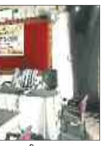
सभाकक्ष का जला एसी।

हराणी की बात तो यह है कि कक्ष में रात को आग लगी लेकिन इसकी भनक किसी को नहीं लग पाई। आज सुबह जब कर्मचारी ने सफाई करने के लिए कमरा खोला तो उसके होश उड़ गए। बता दें कि जिला पंचायत परिसर