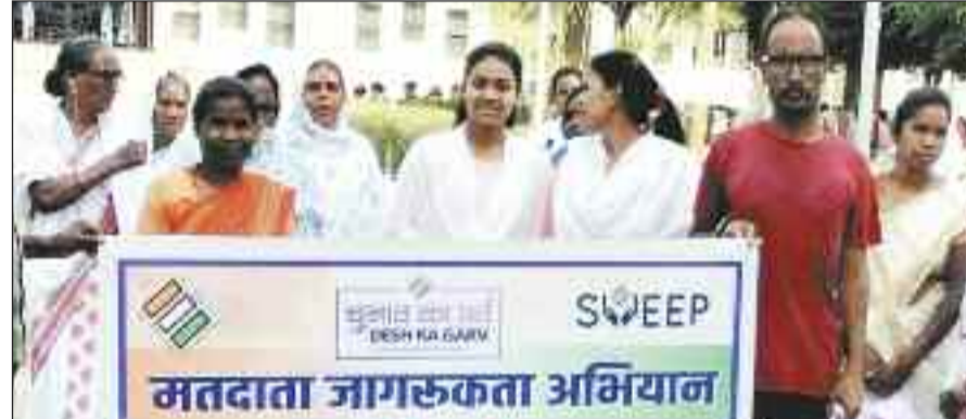
मतदाता जागरूकता कार्यक्रम में शामिल स्व सहायता समूह की सदस्य।

लोकसभा निर्वाचन 2024 में शत-प्रतिशत मतदान के लिए जिले भर में मतदाता जागरूकता अभियान चलाया जा रहा है। विभिन्न ग्राम पंचायतों की स्वयं सहायता समूह की महिलाओं द्वारा सभी कलस्टर में नए मतदाताओं को मतदान हेतु प्रेरित किया जा रहा है। इसी कड़ी में फरसाबाहार समूह की महिलाओं ने मतदाता जागरूकता रैली निकालकर लोगों को मतदान के प्रति जागरूक किया। इस दौरान समूह की महिलाओं ने गीतों व स्लोगनों के जरिए लोगों को शत-प्रतिशत मतदान हेतु सन्देश दिया। हाथों में वोट देने की अपील की तख्तियां में देश का भाव