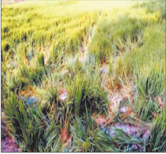
हाथियों के द्वारा रौंदी गई फसल।

जिले के जंगली इलाकों में इन दिनों 72 हाथियों का दल अलग अलग विचरण कर रहा है। भोजन और पानी की तलाश में प्रतिदिन हाथियों का दल ग्रामीण क्षेत्रों की ओर पहुंचकर फसलों को नुकसान पहुंचा रहे हैं। इसी क्रम में बीती रात हाथियों ने 19 किसानों की फसलों को नुकसान पहुंचाया है। गर्मी शुरू होते ही रायगढ़ जिले के जंगलों में विचरण करने वाले गजराजों का आतंक शुरू हो जाता है। भोजन और पानी की तलाश में भटकते भटकते गजराजों का दल अक्सर गांव पहुंचकर ग्रामीणों की फसलों व घरों को नुकसान पहुंचाकर वापस जंगलों की ओर लौट जाते हैं। रायगढ़ जिले के धरमजयगढ़ वन मंडल में इन दिनों जहां 58 हाथी अलग अलग रेंज में विचरण कर रहे हैं। जिसमें कापू रेंज के मिरोगुड़ा में सर्वाधिक 33 हाथी विचरण कर रहे हैं। लोगों में भय का माहौल बना हुआ है। इसी तरह रायगढ़ वन मंडल के अलग अलग रेंज में 14 हाथियों का दल विचरण कर रहा है। जिसमें घरघोड़ा के डेहरीडीह में सर्वाधिक 8 हाथी और उसके बाद बंगुरसिया में 5 हाथी विचरण कर रहे हैं।