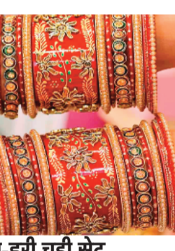
लाल-हरी चूड़ी सेट

हाथों की खूबसूरती को बेगुना करने के लिए आप रंग-बिरंग चूड़ियों को लाल रंग के कंगन के साथ भी पहन सकती हैं। हम सभी ट्रेडिशनल लुक के साथ तरह-तरह के चूड़ी के सेट बनाकर पहनते हैं। वहीं सुहागने ज्यदातर लाल रंग की चूड़ियां पहनना पसंद करती हैं। हालांकि चूड़ियों को इंडो-वेस्टर्न और कईवेस्टर्न लुक्स के साथ भी स्टाइल किया जाने लगा है। लाल रंग में आपको कई डिजाइन वाली चूड़ियां देखने को मिल जाएंगी, जिन्हें आप कई तरीके से हाथों में पहन सकती हैं और हाथों की खूबसूरती को बढ़ा सकते हैं। तो चलिए आज हम आपको दिखाने वाले हैं लाल रंग की चूड़ियों के कुछ नए सेट और बताएंगे इन्हें स्टाइल करने के कुछ आसान तरीके-