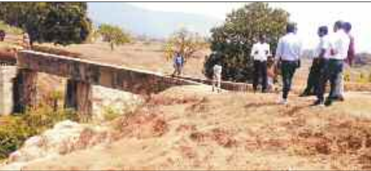
जीर्ण शीर्ण बने डैम के पुलिया करते निरीक्षण करते कलेक्टर।

कक्ष में लगे प्रोजेक्टर, अन्य उपकरण, सोफा, कुर्सी टेबल व दूसरे कमरे में रखे सोफा कुर्सियों को नुकसान पहुंचा है। बड़ी बात यह है कि चुनाव के दौरान इस सभाकक्ष का उपयोग प्रशिक्षण व अन्य कार्यों के लिए किया जाता है लेकिन अब आगजनी की घटना के बाद इस सभाकक्ष का उपयोग फिलहाल संभव नहीं है। इसके साथ ही गनीमत रही कि आग सिर्फ एक कमरे तक ही सिमट कर रह गई अन्यथा आग के फैलने पर अन्य कमरे भी चपेट में आ जाते और सभाकक्ष से लगे कमरों में विभागीय फाइलें मौजूद हैं।