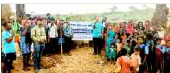
मतदाता जागरूकता कार्यक्रम में भाग लेते स्कूली बच्चे।