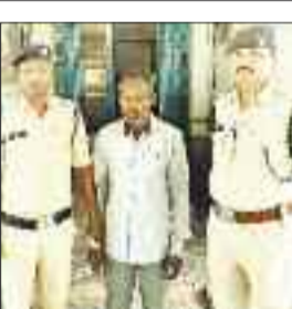
समाकक्ष का जला एसी।