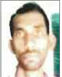
जिलाबदर किए गए आरोपी।